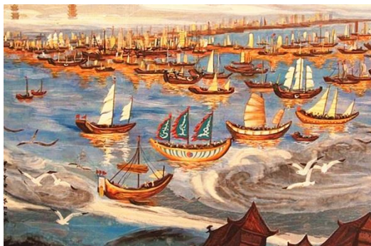
Lodě v přístavu Čchüan-čou ( Zayton ), 13. století

Odorik přijel do Číny, kde již fungovala františkánská mise. Františkánští biskupové ve třech městech na jihovýchodním pobřeží Číny zřídili tři sídla ( loca ): jedno bylo v Čchüan-čou, druhé v Chang-čou a třetí v Jang-čou. Město Čchüan-čou ( Zayton ) v dnešní provincii Fu-ťien bylo ve 14. století sídlem sufragánního biskupství, které krátce před Odorikovým příjezdem založil (roku 1313) chánbalický arcibiskup Jan z Montecorvina: „ Odešel jsem odtamtud (tj. z Kantonu) a poté, co jsem prošel mnoha zeměmi a městy, přišel jsem do vznešeného města jménem Zaycio (Zaytio?), v němž naši menší bratři mají dvě sídla [...]. “ Odorik přijel do Zaytonu kolem roku 1324. Z biskupů vysvěcených v roce 1307 byl v té době naživu pouze jediný: Ondřej z Perugie. V Zaytonu Odorik pravděpodobně, alespoň podle většiny rukopisů jeho cestopisu, uložil ostatky mučedníků z Thány. Zdá se, že misionářské úspěchy byly v tomto městě okamžité. Jak víme z dopisů Peregrina z Castella, Ondřeje z Perugie a Jana Marignoly, byly zde postaveny celkem tři kostely.