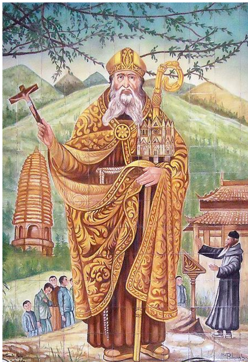
Jan z Montecorvina