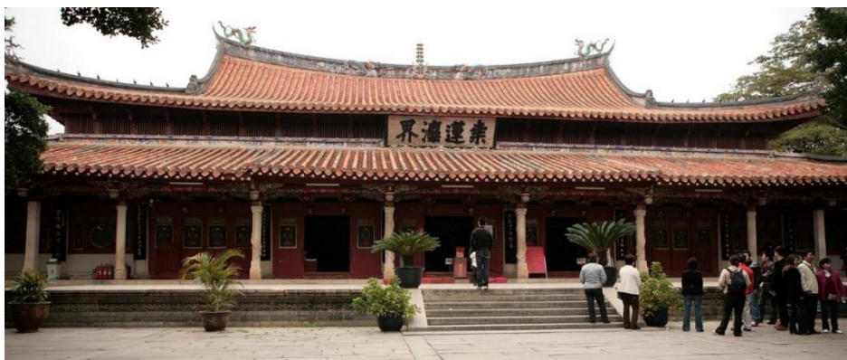
Hlavní hala kláštera

Během svého pobytu v Zaytonu Odorik navštívil místní buddhistický klášter, který, jak se zdá, na něj udělal patřičný dojem: „Je tam mnoho klášterů vyznavačů, kteří uctívají modly. I já jsem [byl] v jednom klášteře, v němž byly tři tisíce oněch vyznavačů, kteří měli ve své péči jedenáct tisíc model. A jedna [z těch model], jež se zdála menší než ostatní, byla tak velká, jako se u nás zobrazuje svatý Kryštof. Byl jsem tam náhodou v tu dobu, kdy krmí své bohy, a viděl jsem, že všechna jídla, která jim lidé obětují, jsou velmi horká [...].“ Někteří autoři se domnívají, že tímto klášterem byl Kchaj-jüan-s’ (開元寺 Kāiyuán Sì ), založený roku 686 pod jménem Lien-chua-s’ (蓮花寺 Liánhuā Sì , „Klášter leknínu“). Dnešní jméno dostal tento klášter za éry Kchaj-jüan (713–741) dynastie Tchang.