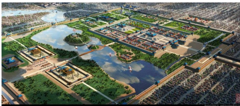
Chánbalyk v Odorikově době (rekonstrukce)