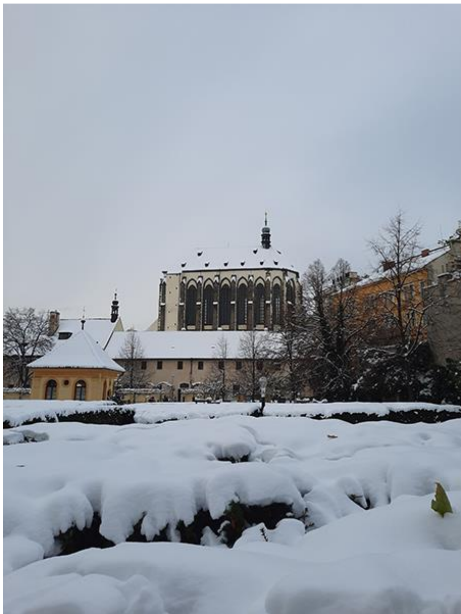
Když Prahu pokrýl sníh...