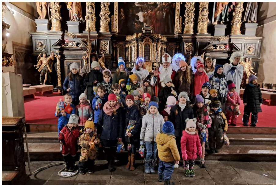
Z Mikulášské bojovky

všední dny: 8.00, 18.00 (po mši sv. večerní nešpory) neděle: 9.00, 10.15 (pro rodiny s dětmi), 11.30, 18.00 denně: modlitba růžence půl hodiny přede mší sv. čtvrtek: 19.00–20.00 tichá adorace v kapli sv. Michala Pobožnost u hrobu 14 mučedníků bude v pondělí 15. 1. v 19.00 hodin.