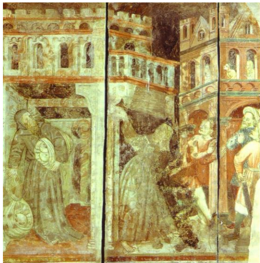
Odorik přenáší ostatky umučených františkánů z indické Thány do jižní Číny. Freska z kostela sv. Františka (Chiesa di San Francesco), Udine.

se, že scéna měla znázorňovat příjezd čtyř františkánů do Thány. Na poměrně neporušené části prvního výklenku vpravo nahoře je zobrazen