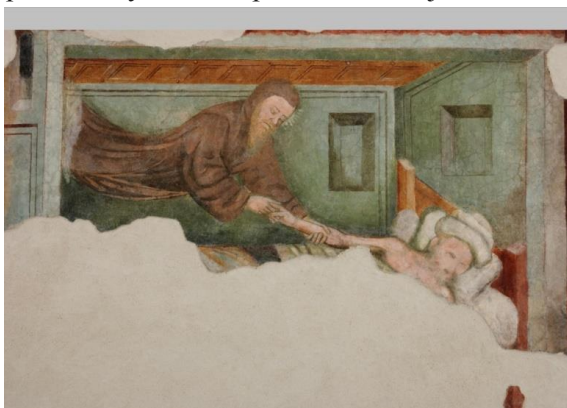
Odorik se vznáší se nad lůžkem nemocného. Freska z kostela sv. Františka (Chiesa di San Francesco), Udine. Zázrak č. 19 Miraculum Gallucii de Cordivado ze seznamu zázraků připojeného k některým rukopisům Odorikova cestopisu

hodnostář na trůně v dlouhém šatu okrové barvy doprovázený řadou funkcionářů se špičatými kónickými čapkami, snad mongolského typu. Scéna pravděpodobně zachycuje epizodu, kdy uvedení františkáni stáli před soudem kádiho v Tháně. Na další scéně jsou františkáni vyváděni strážemi na prostranství, kde je rozdělán oheň. Ztvárnění vojáků napovídá o jisté malířově znalosti orientálního, zejména mongolského vojska. V centrální scéně jsou obžalovaní a žalobci před melichem, místním vládcem.