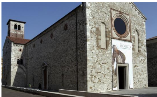
Kostel sv. Františka (Chiesa di San Francesco), Udine, 13. století.

Podle Odorikova textu o umučení františkánských bratří v indické Tháně vznikl v 15. století velmi působivý cyklus fresek, pokrývající původně obě boční stěny bývalého kostela sv. Františka v Udine. V rámci prací na restrukturalizaci kostela byly fresky sejmuty krátce před 2. světovou válkou, v letech 1938 a 1939.