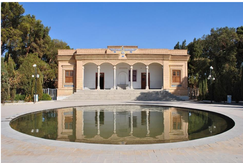
Dnešní podoba zoroastrijského chrámu ohně v Jezdu s počátky kolem roku 470.

Starobylé město Jezd, asi 500 km jihovýchodně od Teheránu, bylo důležitým uzlem karavanních cest. V době islámského dobytí Persie v 7. století, stejně jako za Čingischánovy invaze na počátku 13. století se Jezd stal útočištěm umělců, intelektuálů a učenců z celé Persie. Strategicky situovaný na cestě z Teheránu a Isfahánu do Kermánu a téměř v samém geometrickém středu Persie, vynikal Jezd odedávna znamenitou řemeslnou výrobou. Již ve 13. století byl znám výrobou jemného hedvábí, které Marco Polo nazývá yasdi , a proslul i obchodováním s nejrůznějším ovocem (fíky, hrozkami, granátovými jablky, vinnými hrozny, melouny atd.).