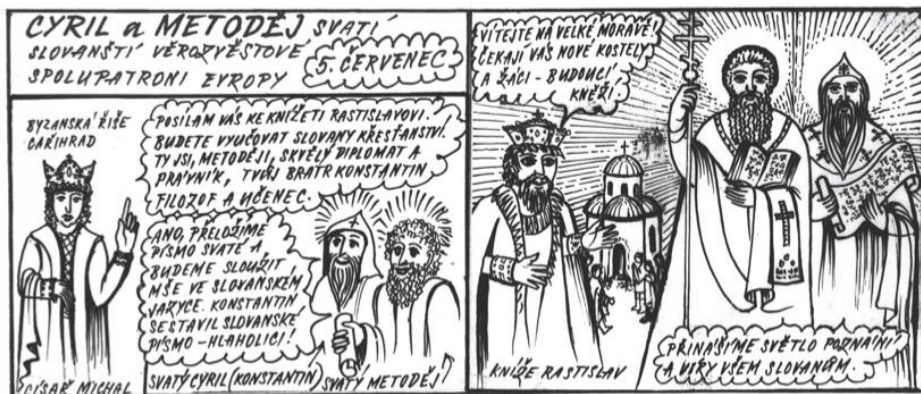
Ilustrace: Eva Řádková