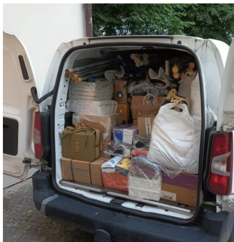
Zdravotnický materiál pro Ukrajinu