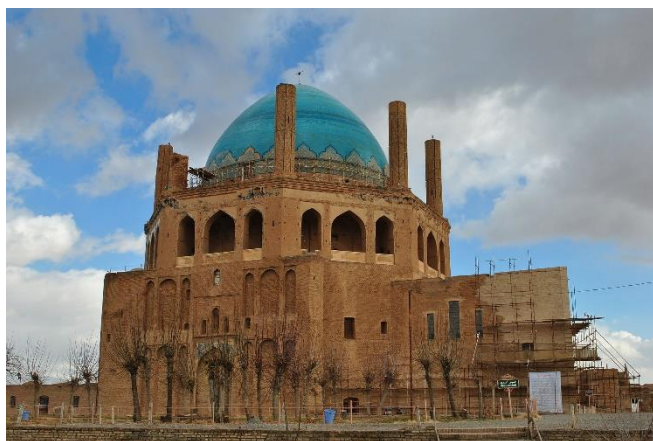
Zrekonstruované mauzoleum ilchána Öldžejtū (též Muhammad Chodábende) z let 1302–1312 v Sultanii. Památka známá též jako Dóm v Sultanii.

blízko jejího ústí do Kaspického moře. Dnešní Kaspické moře se ve středověku většinou nazývalo Bakuské moře (u Marka Pola mare Abacou, mare Abacuc , podobně i u Odorika) podle přístavního města Baku.