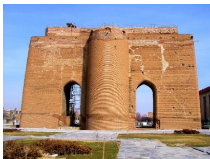
Brána městského opevnění Tabrízu

Z Erzerum (dnešní Erzurum ve východním Turecku) pokračoval Odorik do Persie, tehdejšího mongolského Ílchanátu. Ílchanát, Ílchánská říše, byl jeden ze čtyř ulusů či chanátů na území někdejší jednotné Mongolské říše (1256–1335). Na území mongolské Persie pobyl Odorik několik let. Stejně jako Jan z Montecorvina třicet let před ním i on prošel perským Tabrizem, tehdejším významným obchodním centrem. V dobách Mongolské říše byl Tabriz v letech 1270 až 1305 hlavním městem Ílchanátu; v pozdějších stoletích byl centrem nástupnických říší. V tomto městě byly již od roku 1280 dva františkánské konventy. „Toto však vznešené město je lepší, pokud jde o zboží než kterékoli jiné město na světě. Neboť není žádná potravina či nějaká užitečná věc, nezbytnost nebo zboží, jež by se tam nenašlo ve velkém množství. Je také velmi vysoko položeno. Vpravdě téměř celý svět si s tímto městem vyměňuje zboží. A říkají to křesťané, že onen císař získává na daních [z tohoto města] více než král Francie z celé své říše.“