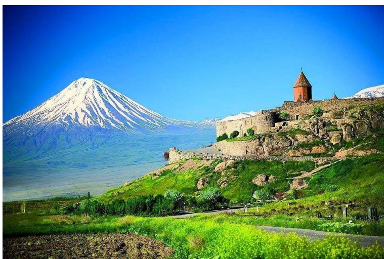
Pohled na Ararat (dnes na území Turecka) z Arménie

říkali místní obyvatelé, že se ještě nikomu nepodařilo [na ni] vystoupit. Neboť, jak říkali, by se to nelíbilo bohu nejvyššímu.“