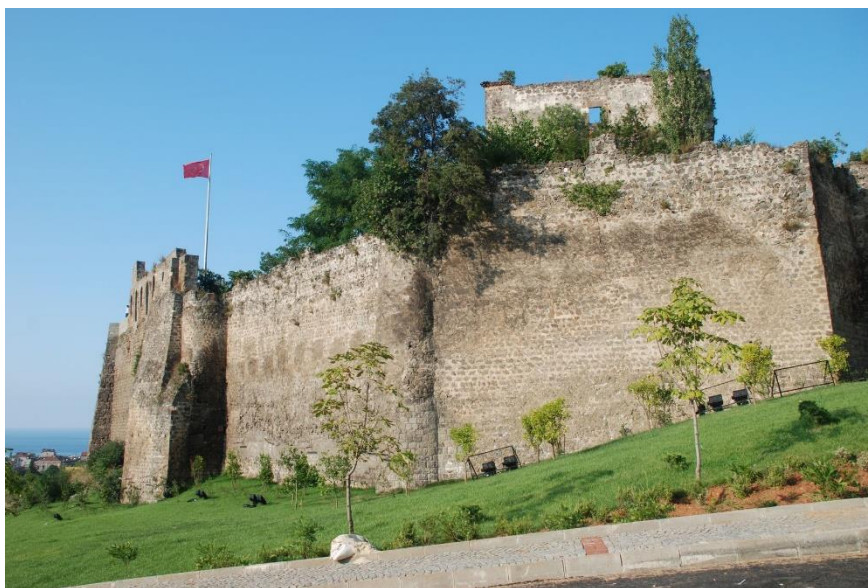
Citadela v dn. Trabzonu

Posledně jsme Odorika opustili v Trapezuntu na pobřeží Černého moře, dnes součásti Turecka. Ještě na doplnění dodejme, že prosperita tehdejšího Trapezuntského císařství byla založena na tranzitním obchodu a těžbě stříbra. V obchodu hráli vedoucí úlohu Janované, kteří roku 1306 v Trapezuntu získali tzv. hrad Leoncastro (ve skutečnosti nefungoval nikdy jako hrad), který poté tvořil součást janovského opevnění Trapezuntu. Dějiny citadely, která na tomto místě dosud stojí, sahají údajně až do doby kolem roku 2000 před n. l. Obchodní cesta z Trapezuntu do Tabrízu, kam poté Odorik pokračoval, byla v té době ve skutečnosti janovskou obchodní cestou.