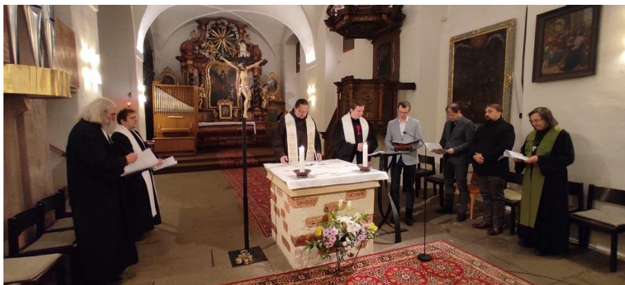
Ekumenická bohoslužba 30. ledna 2023

všední dny: 8.00, 18.00 (po mši sv. večerní nešpory) neděle: 9.00, 10.15 (pro rodiny s dětmi), 11.30, 18.00 denně: modlitba růžence půl hodiny přede mší sv. čtvrtek: 19.00–20.00 tichá adorace v kapli sv. Michala Pobožnost u hrobu 14 mučedníků bude ve středu 15. 2. v 19.00 hodin.