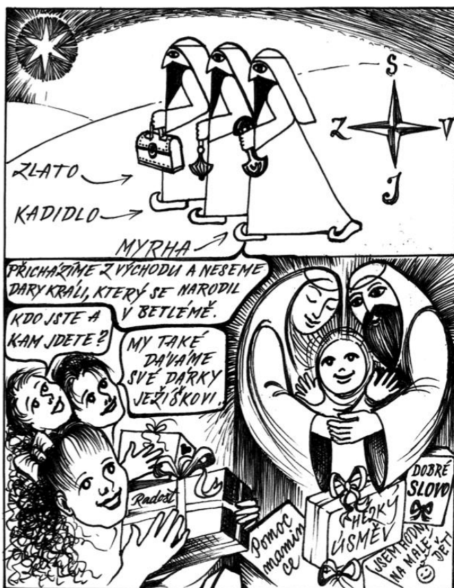
Ilustrace: Eva Řádková

Pokud by někdo projevil dobrou vůli a chtěl koledovat např. po mších svatých, zapečetěné kasičky budou k dispozici v sakristii, kde si je přede mší sv. můžete vyzvednout a po konci koledování je tam opět vrátit. TKS končí oficiálně 15. ledna 2023, po tomto termínu budou kasičky odevzdány charitě. Předem děkujeme za účast a těšíme se na shledanou!