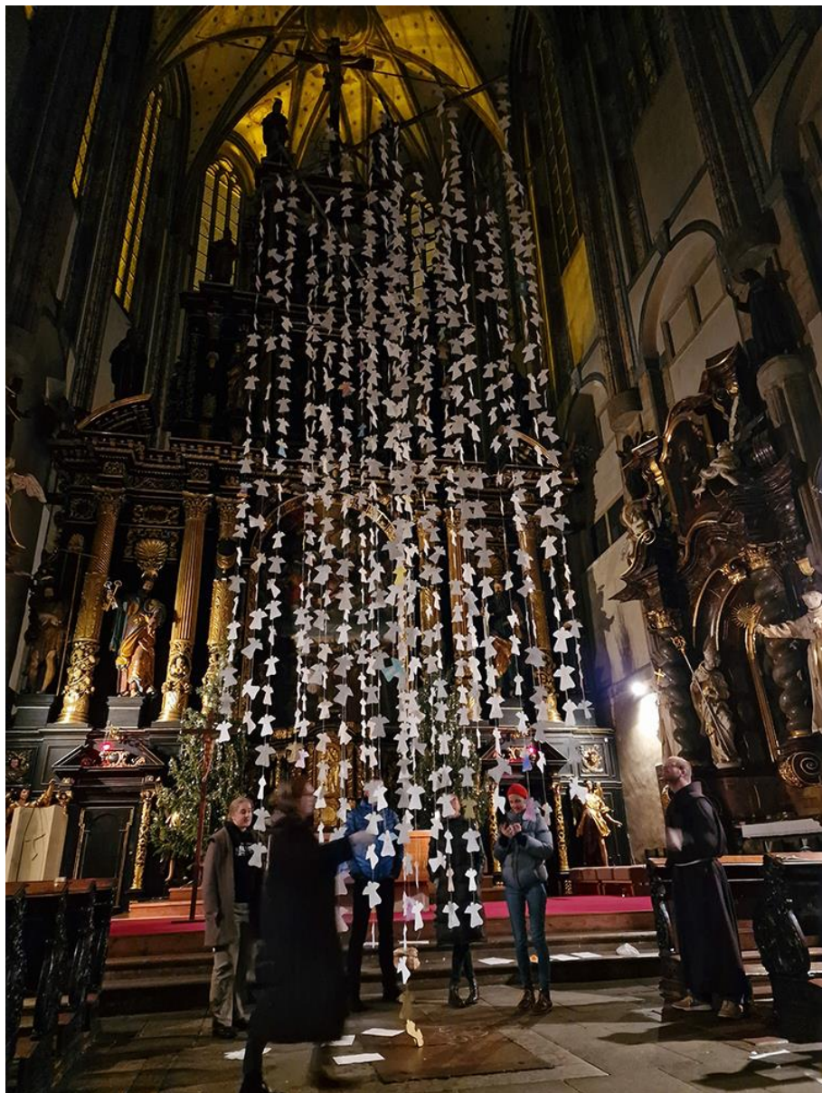
Ze zavěšování andělíčků