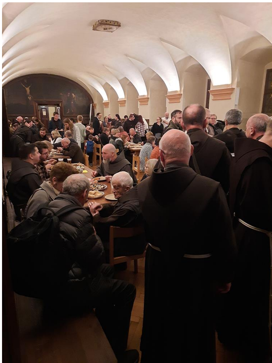
Agapé u příležitosti 10. výročí blahorečení XIV pražských mučedníků