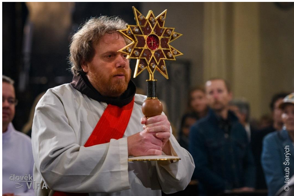
Snímky z 10. výročí blahověnění XIV pražských mučedníků