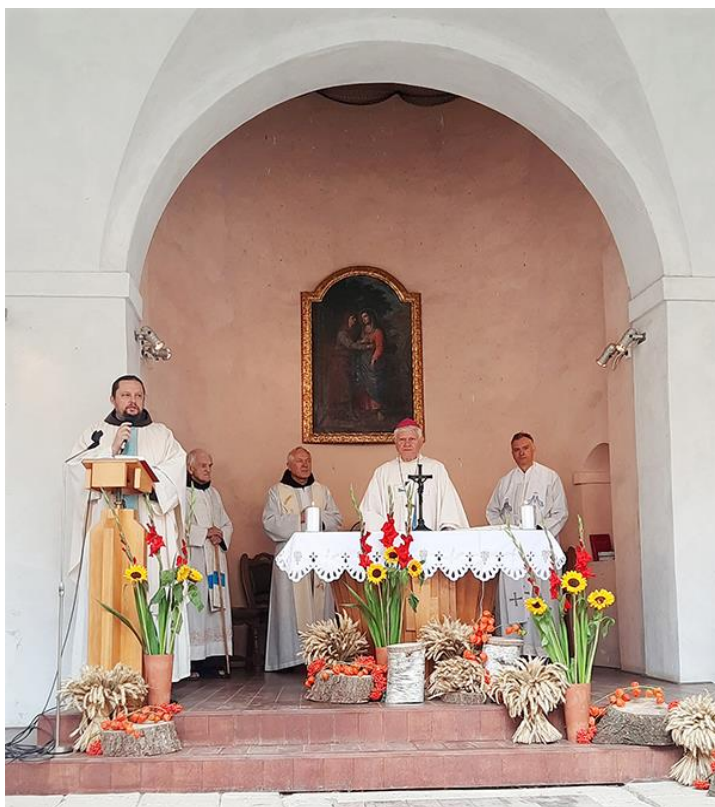
Z hlavní hájecké pouti