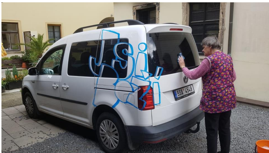
Z františkánských misí v Děčíně