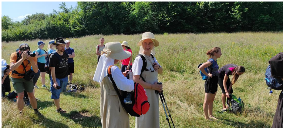
Z františkánské pouti mládeže

Pobožnost u hrobu 14 mučedníků bude ve čtvrtek 15. 9. v 19.00 hodin.