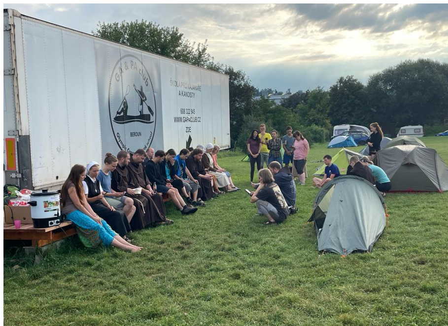
Z františkánské pouti mládeže