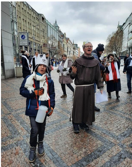
Tříkrálové koledování

Pobožnost u hrobu 14 mučedníků bude v úterý 15. 2. v 19.00 hodin.