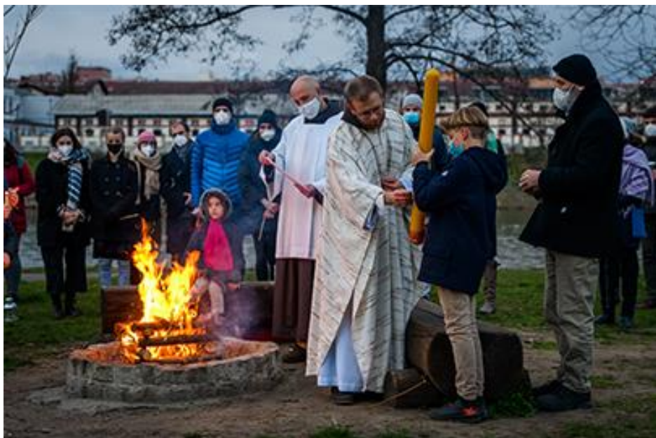
Z vigilie na Štvanici

Pobožnost u hrobu 14 mučedníků bude v sobotu 15. 5. v 19.00 hodin.