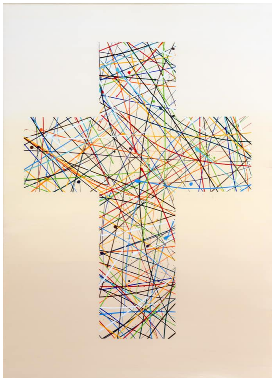
Obraz Bílý kříž br. Cyrila OFM