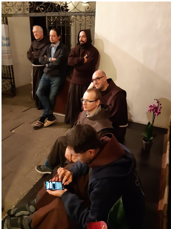
Bratři františkáni na koncertě Pavla Helana